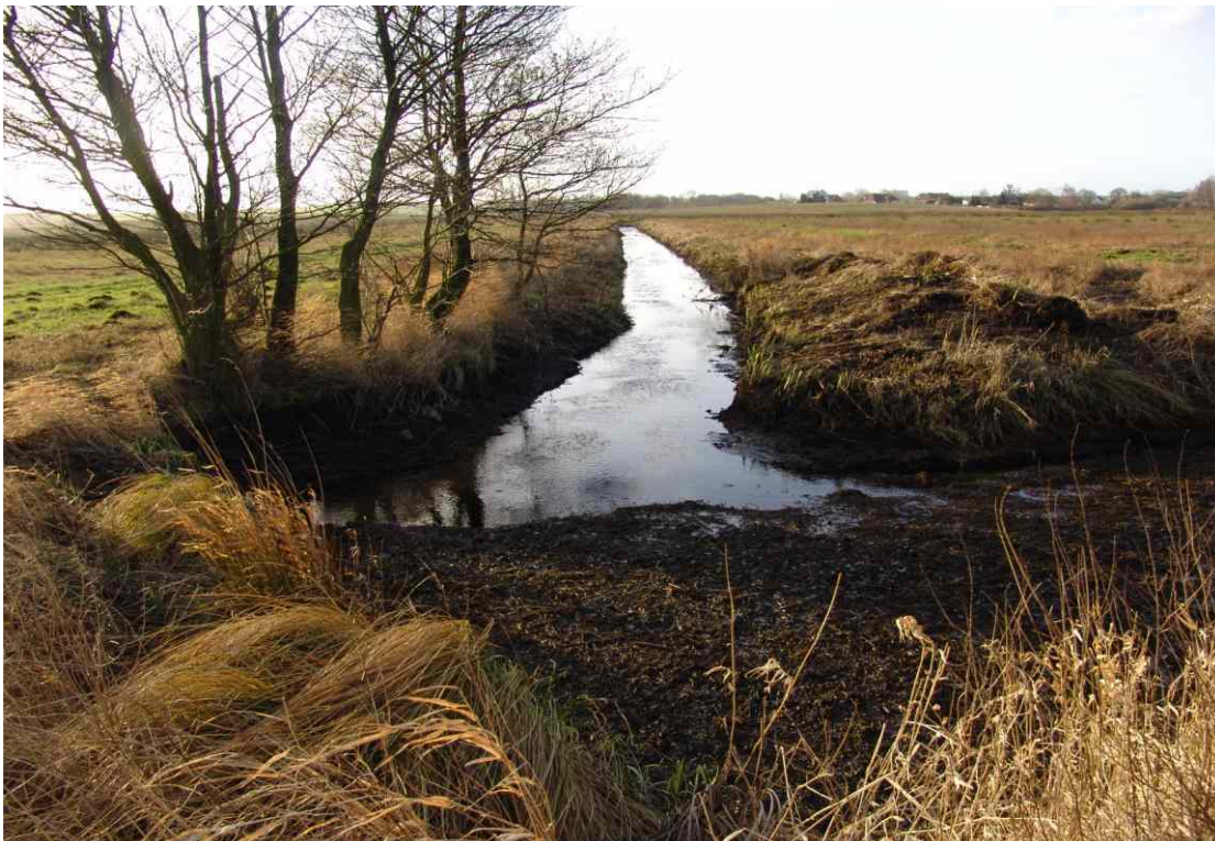
nach der Grabensanierung 2001