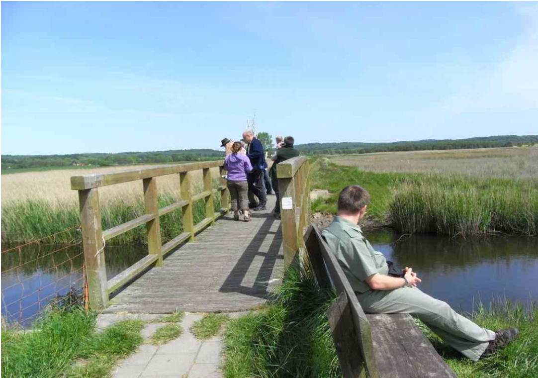
Brücke über den Durchstich (Foto 2008)