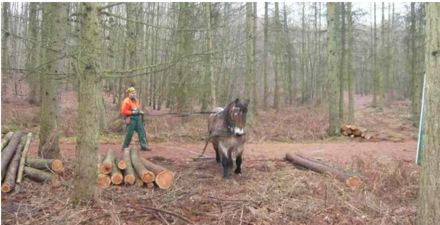
Auslichten von Nadelholzbeständen

Folgemaßnahmen: Um die Zielstellung eines plänterartigen Laubmischwaldes erreichen zu können, sind noch über einen längeren Zeitraum Waldumbaumaßnahmen erforderlich (Auslichtung Nadelholzbestände und Einzelstammentnahme im Laubwald). Welche Maßnahmen wann und wo durchgeführt werden, wird jährlich in Abhängigkeit vom Entwicklungsstand in den Beständen festgelegt. Im Naturwaldareal werden keine Maßnahmen durchgeführt. Die FFH-Managementplanung ist fertig gestellt und muss mit dem PEPL abgestimmt werden.