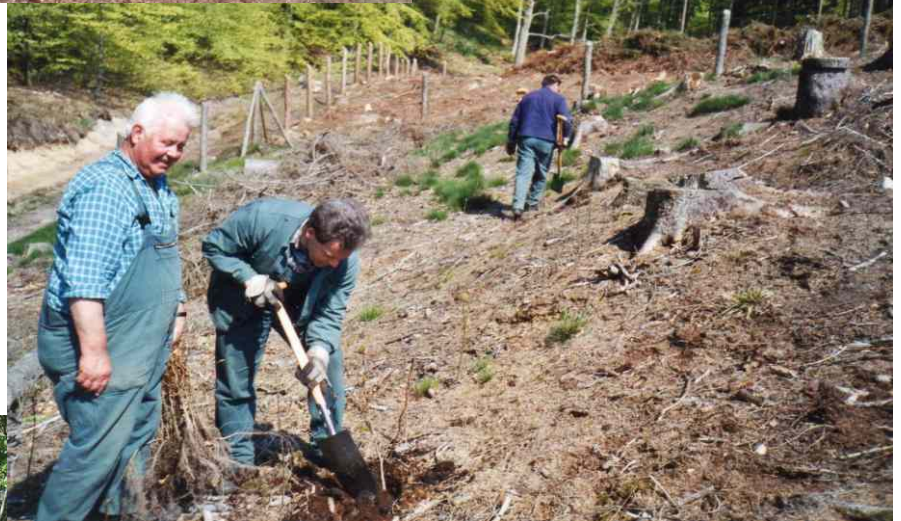
Anpflanzung von Traubeneiche nach Kahlhieb