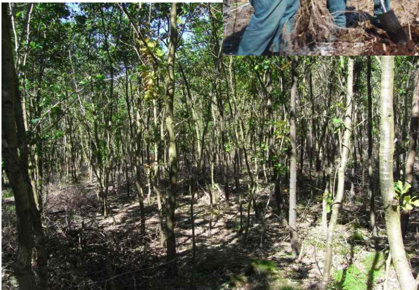
Jungwuchspflege in Laubholzbestand