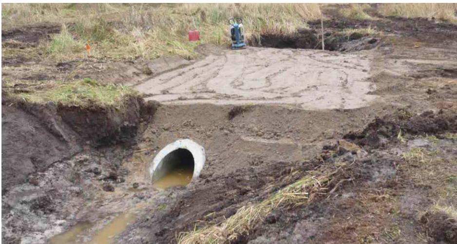
Neugestaltung von Überfahrten