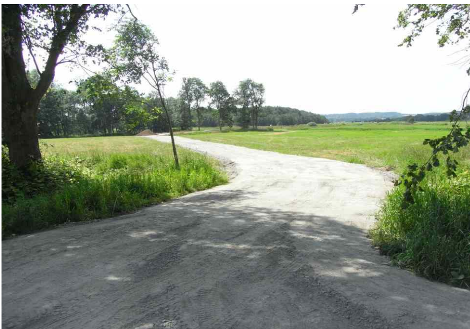
Anlage einer Fahrtrasse für den landwirtschaftlichen Verkehr