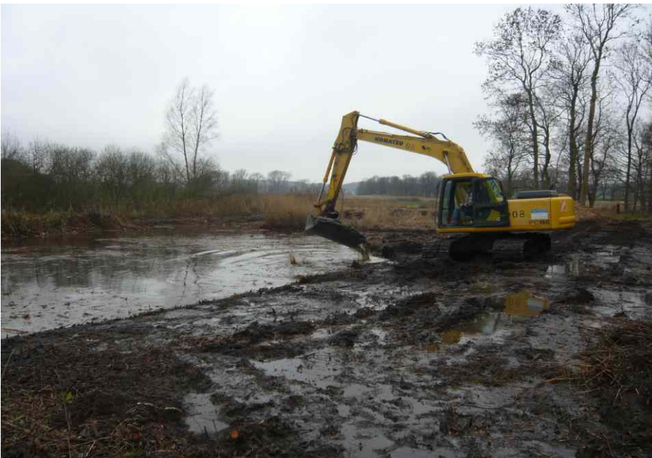
Entschlammung des Dorfteiches