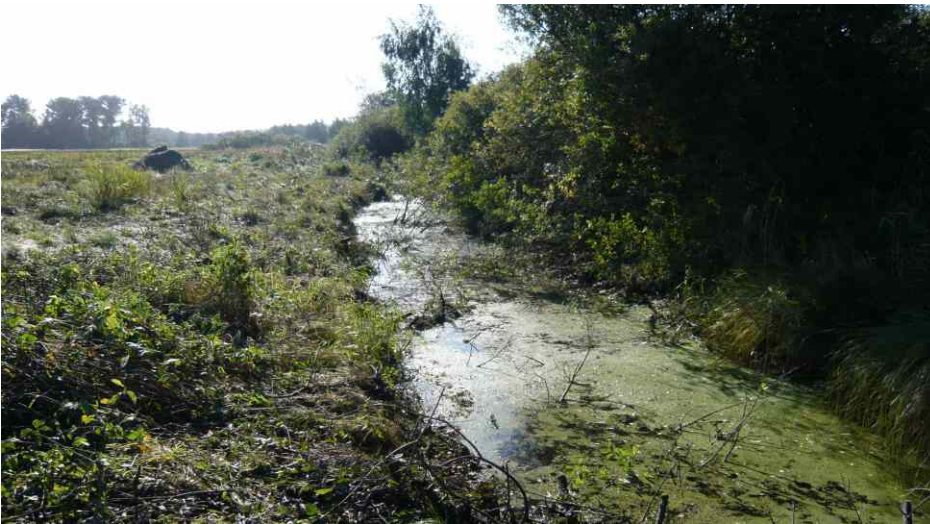
Holzungsarbeiten an den Gräben

Das Grünland wird weiterhin extensiv bewirtschaftet (Vertrag über naturschutzgerechte Grünlandnutzung). Nach Ablauf des Pachtvertrages 2018 hat der LPV vollen Zugriff auf die Eigentumsflächen. Es werden dann Flächen aus der Nutzung gehen (Erlensukzession), da für die Maßnahme ein Ausgleich nach Landeswaldgesetz erforderlich ist.