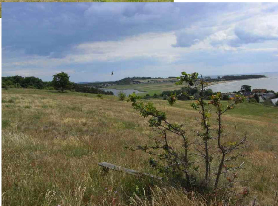
Ist-Zustand (Foto aus 2008)