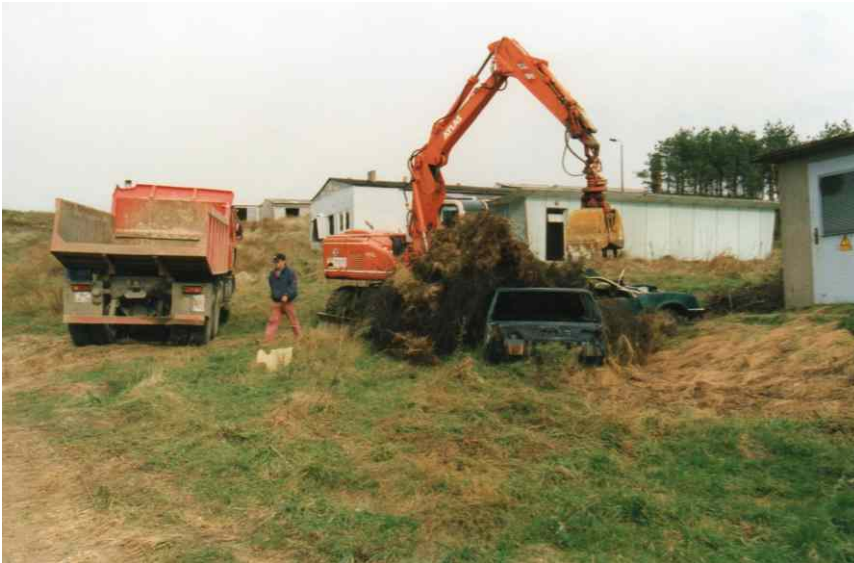
russische Radarstation zu Beginn der Maßnahme