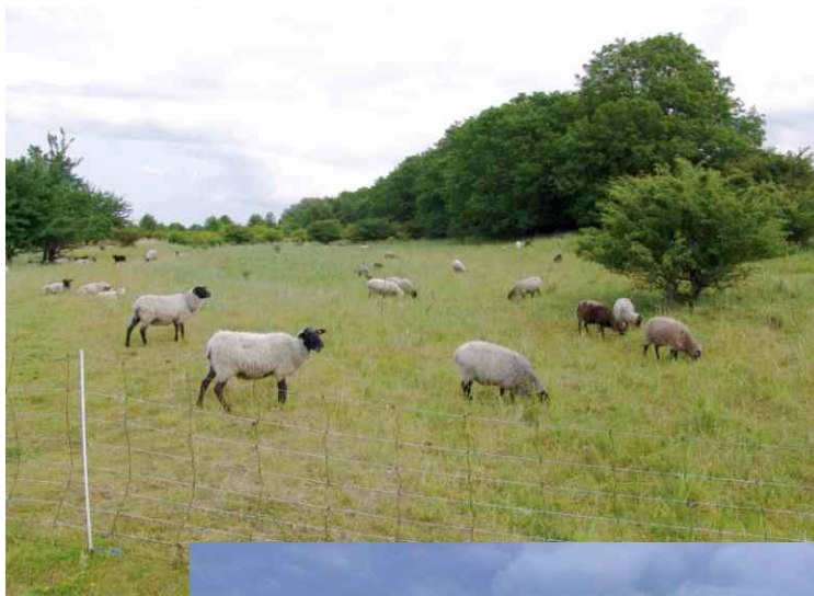
Pflege durch Schafbeweidung