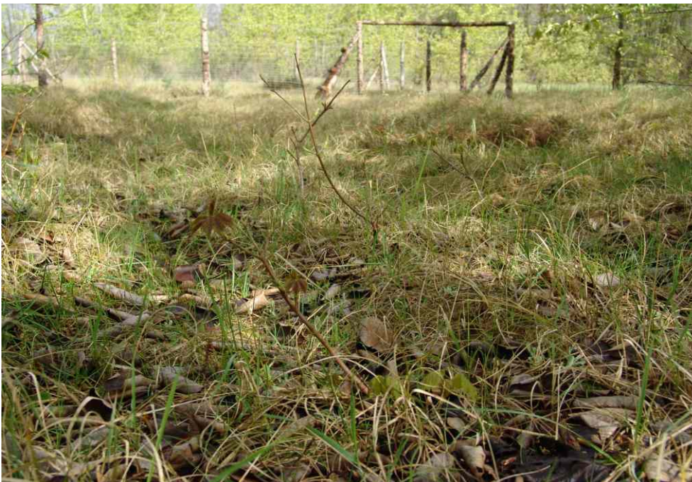
schon wenige Jahre später waren erste Erfolge in Bezug auf eine Naturverjüngung zu beobachten (Foto 2008)