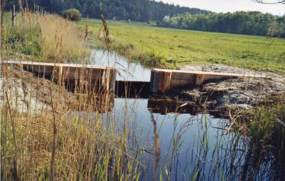
neu errichteter Stau