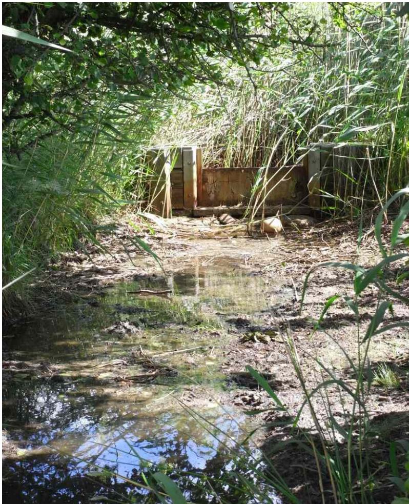
die Stau efügen sich sehr gut in das Landschaftsbild ein (Foto 2008)