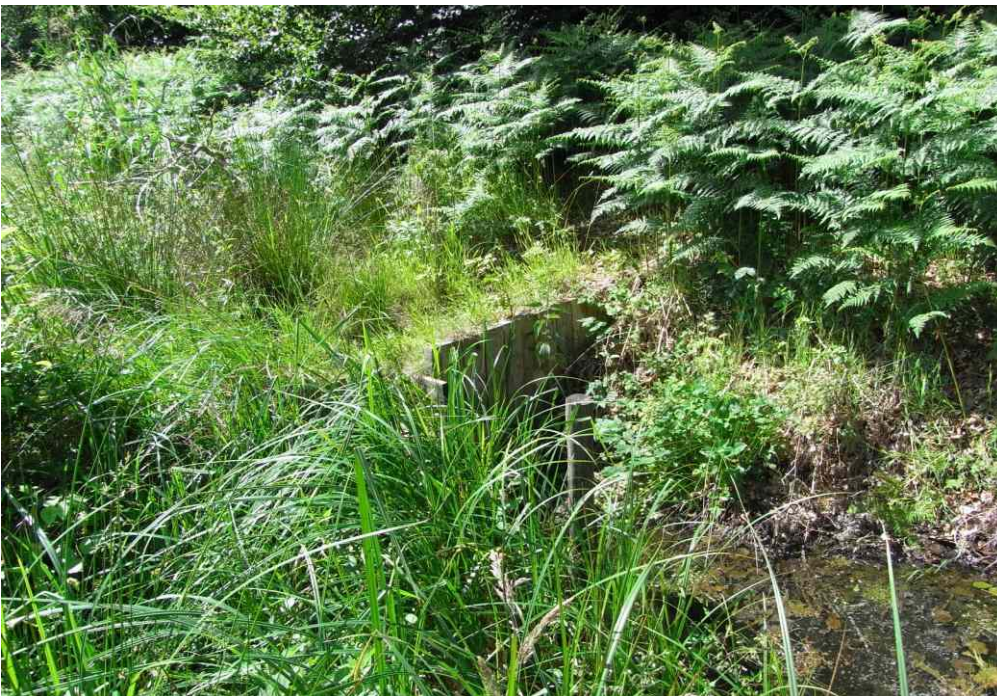
Stau fügt sich sehr gut in die Umgebung ein und ist fast unsichtbar (Foto 2008)