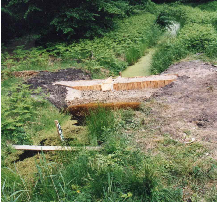
neu errichteter Stau 2001