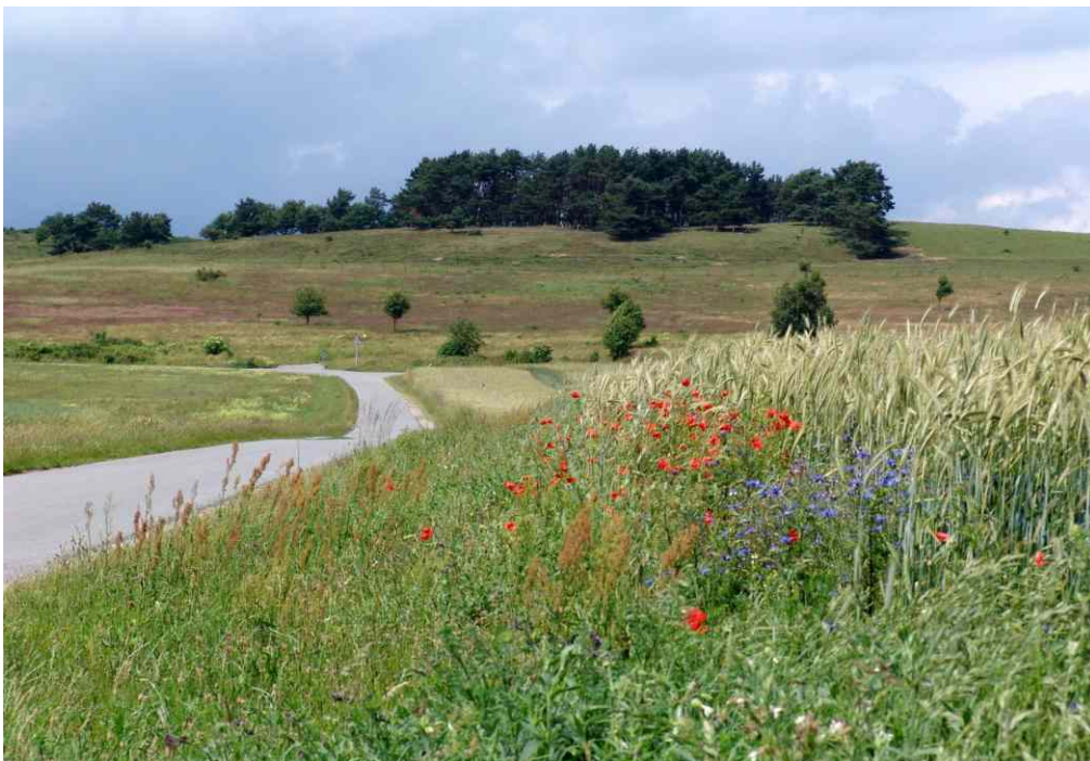
Fliegerberg nach Beendigung der Maßnahme