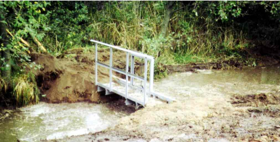
Abriegeln des Stichgrabens mit regulierbarem Stau

Folgemaßnahmen: weitere Pflege der Feuchtwiesen (StALU)